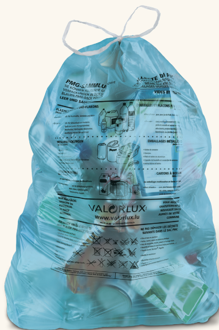
Sac bleu PMC VALORLUX